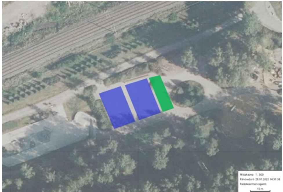
Padelkenttien sijoitus Thurmaninpuiston hiekkakentälle sinisellä (vihreällä ulkokuntosali)

Liikuntapalvelut on kartoittanut yhteistyössä maankäytön kanssa sopivinta sijoituspaikkaa. Soveltuin alue osoittautuu olevan Thurmaninpuiston hiekkakentälle. Kyseisellä hiekkakentällä ei tällä hetkellä ole toimintaa. Aivan Thurmaninpuiston hiekkakentän läheisyydessä sijaitsee vapaassa käytössä, klo 08-20, 2h rajoitteilla olevia parkkipaikkoja, mitkä palvelisivat myös autolla padelkentille saapuvia kuntalaisia.