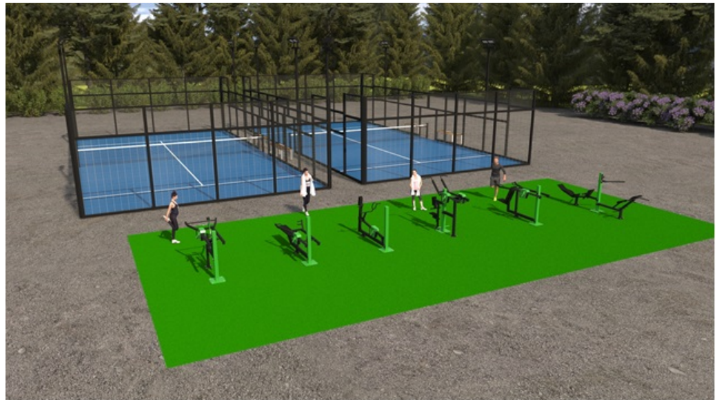
Havainnekuva padelkentistä ja ulkokuntosalista kokonaisuutena

Kaupunginhallituksen 31.5.2021 § 118 hyväksymässä Kauniaisten liikuntapaikkasuunnitelmassa, toimenpideohjelman mukaan, Thurmanipuistoon on suunniteltu lähiliikuntapaikan perustamista. Samaisessa toimenpideohjelmassa on tarkoitus lisätä ulkokuntosaleja Kauniaisiin ja tätä tukee myös 20.9.2021 tehty valtuustoaloite ( oheismateriaali ), missä pyydetään lisää ulkokuntosalilaitteita Thurmanipuistoon. Padelkenttien sijoittamisen suhteen onkin hyvä ottaa huomioon sen läheisyyteen liitettävä ulkokuntosali.