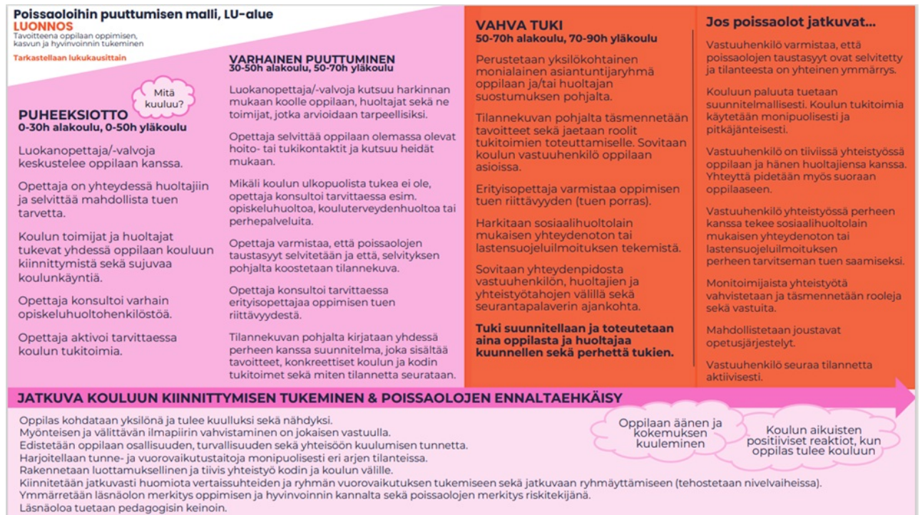
Kuva 1: Poissaolomalli, perusopetus