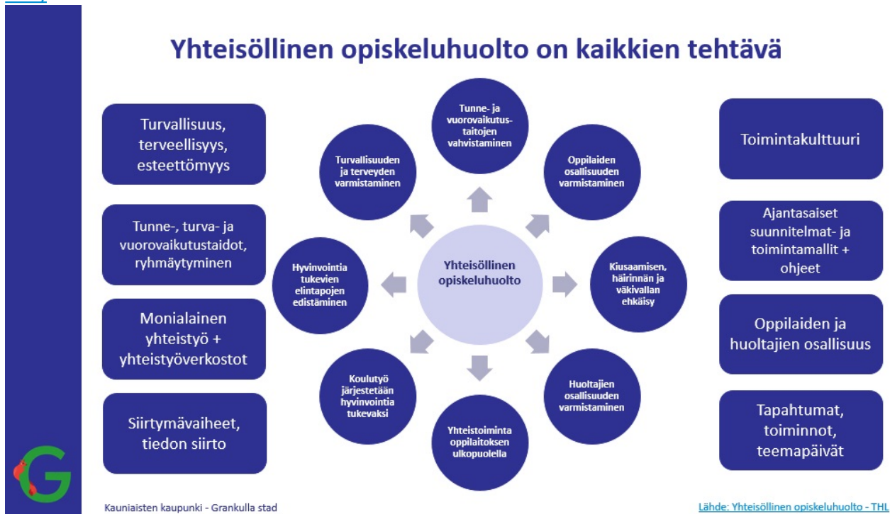
Kuva 2. Esimerkki yhteisöllisen opiskeluhoillon sisällöstä